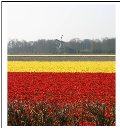
Cultuurlandschap van de Bollenstreek